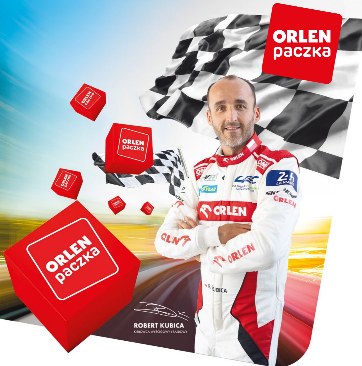
ROBERT KUBICA KIEROWCA WYŚCIGÓWY I RAJDOWY