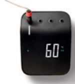
WEBER CONNECT HUB